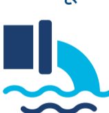
अपशिष्ट जल (वेस्टवॉटर)