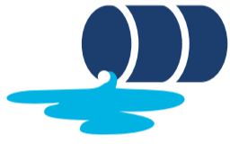
रसायन-पदार्थ का स्पिल होना (छलकना)