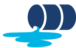
Fuoriuscite di sostanze chimiche