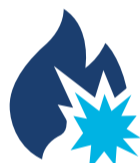
Incendi ed esplosioni