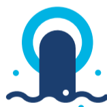
Contaminazione delle acque meteoriche