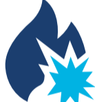
आग और विस्फोट