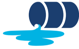
रसायन-पदार्थ का स्पिल होना (छलकना)