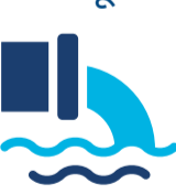
अपशिष्ट जल (वेस्टवॉटर)