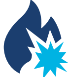
ਅੱਗ ਅਤੇ ਧਮਾਕਾ