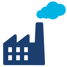
ਹਵਾ ਦਾ ਪ੍ਰਦੂਸ਼ਣ

ਬਹੁਤ ਸਾਰੀਆਂ ਚੀਜ਼ਾਂ ਜੋ ਅਸੀਂ ਕੰਮ 'ਤੇ ਕਰਦੇ ਹਾਂ ਪ੍ਰਦੂਸ਼ਣ ਦਾ ਕਾਰਨ ਬਣ ਸਕਦੀਆਂ ਹਨ ਅਤੇ ਕੂੜਾ-ਕਰਕਟ ਪੈਦਾ ਕਰ ਸਕਦੀਆਂ ਹਨ। ਕੂੜਾ-ਕਰਕਟ ਅਤੇ ਰੀਸਾਈਕਲਿੰਗ ਵਿਚਲੇ ਆਮ ਖ਼ਤਰਿਆਂ ਵਿੱਚ ਸ਼ਾਮਲ ਹਨ: