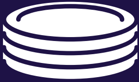
الصحون البلاستيكية لاستخدام واحد

ت حظر هذه المواد البلاستيكية لاستخدام واحد في فيكتوريا