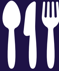
أدوات المائدة البلاستيكية لاستخدام واحد