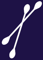
عيدان تنظيف الأذن القطنية المصنوعة من البلاستيك لاستخدام واحد