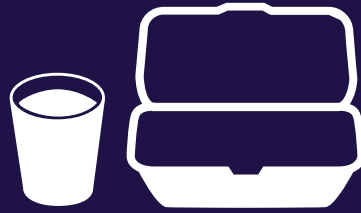
أدوات الطعام والأكواب المصنوعة من البوليسترين الممدد