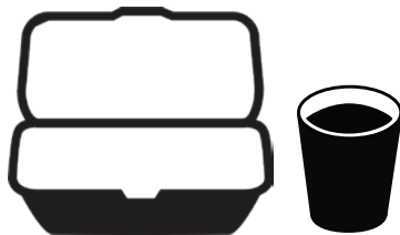
스티로폼 포장음식 용기 및 컵