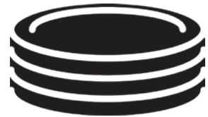
1회용 플라스틱 접시