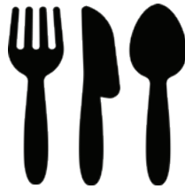
1회용 플라스틱 식기