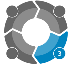
그림 3 과 같이 위험성 관리 대책 선택사항들을 가장 효과적인 조치부터 가장 비효과적인 조치까지 순위를 정하십시오. 이 순서를 정하는 과정에서 관리 대책을 다음 세 범주 중 하나에 배정하십시오.

제거: 가장 효과적인 관리 대책은 해당 유해요소 및 위험을 모두 제거하는 것입니다.