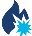
ਅੱਗ ਅਤੇ ਧਮਾਕਾ